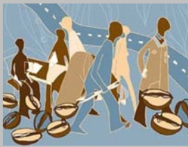
Foro "Trabajo Decente y Libertad Sindical" en Guatemala

Sharan Burrow comunicó a la dirección de la empresa que "la CSI se suma a su afiliada la Central Unitaria de Trabajadores de Colombia para protestar ante esta agresión contra las y los trabajadores y sus organizaciones sindicales y les encarece atender a la brevedad el pliego de peticiones de los trabajadores y sus organizaciones sindicales, tal cual lo pregona en su política de derechos humanos". ( CSI Online, 31.07.2012 )